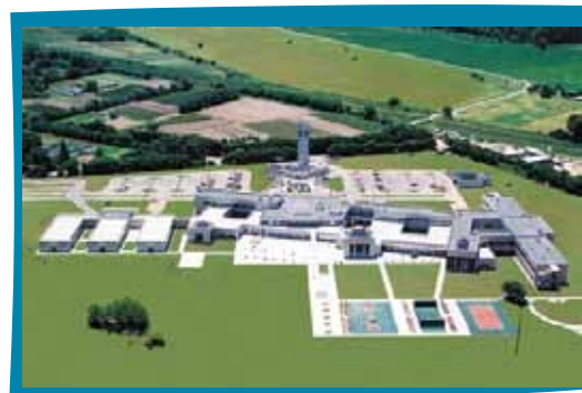
Centro Fleni Escobar

CentraLab ha desarrollado un expertise diferencial, centrado en su equipo profesional y una infraestructura adecuada, que posibilita realizar estudios clínicos en pacientes, para el registro y validación de productos Oncológicos y Biosimilares.